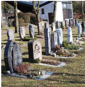
Reihengräber in Mittelfischach

Grundsätzlich gilt, dass sich jeder Bürger der Gemeinde Obersontheim auf jedem Friedhof im Gemeindegebiet bestatten lassen kann, unabhängig vom derzeitigen Gemeindefortort.