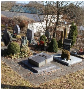
Urnenwahlgräber in Obersontheim