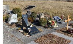
Urnengräber in Untersontheim