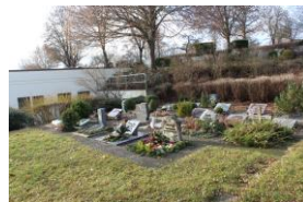
Urnengräber in Obersontheim