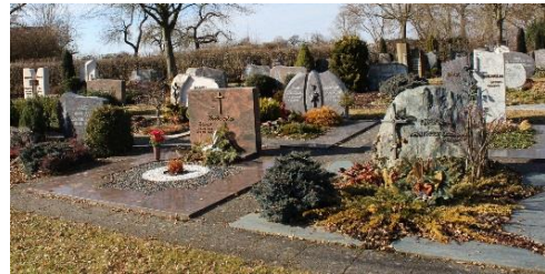
Wahlgräber in Obersontheim

Bei einer Bestattung mit anschließender Urnenbelegung beginnt die Ruhezeit von 20 Jahren ab Beisetzung der Urne. Sofern allerdings die 30 Jahre Nutzungszeit der vorangegangenen Erdbestattung 20 Jahre immer noch überschreiten, ist die längere Nutzungszeit maßgeblich.